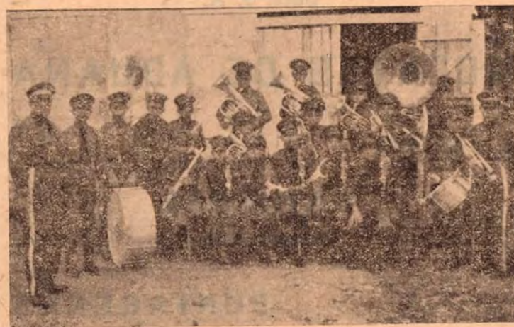
Banda Municipal Infantil de Puerto Cortés, otro acierto de esta Corporación

COSTA RICA DE AYER Y HOY, que lo contó también como uno de sus antiguos suscriptores, lamenta profundamente su partida y aprovecha la oportunidad para hacer presente a su muy apreciable familia, los votos de su mayor simpatía y pesar.